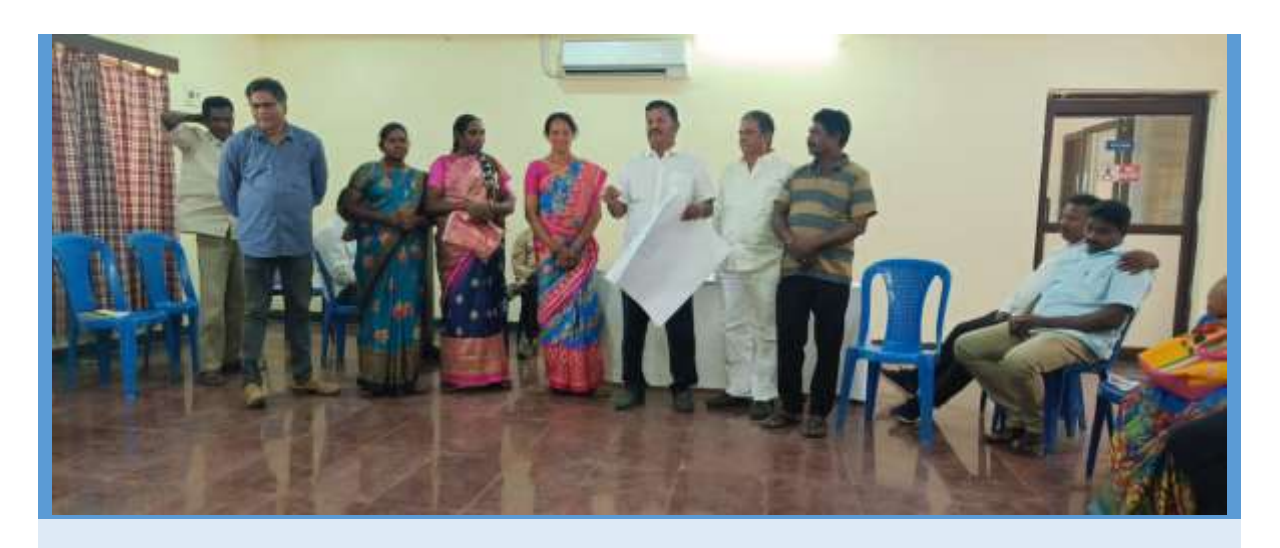
Group Presentation on Rehabilitation and Resettlement issues.