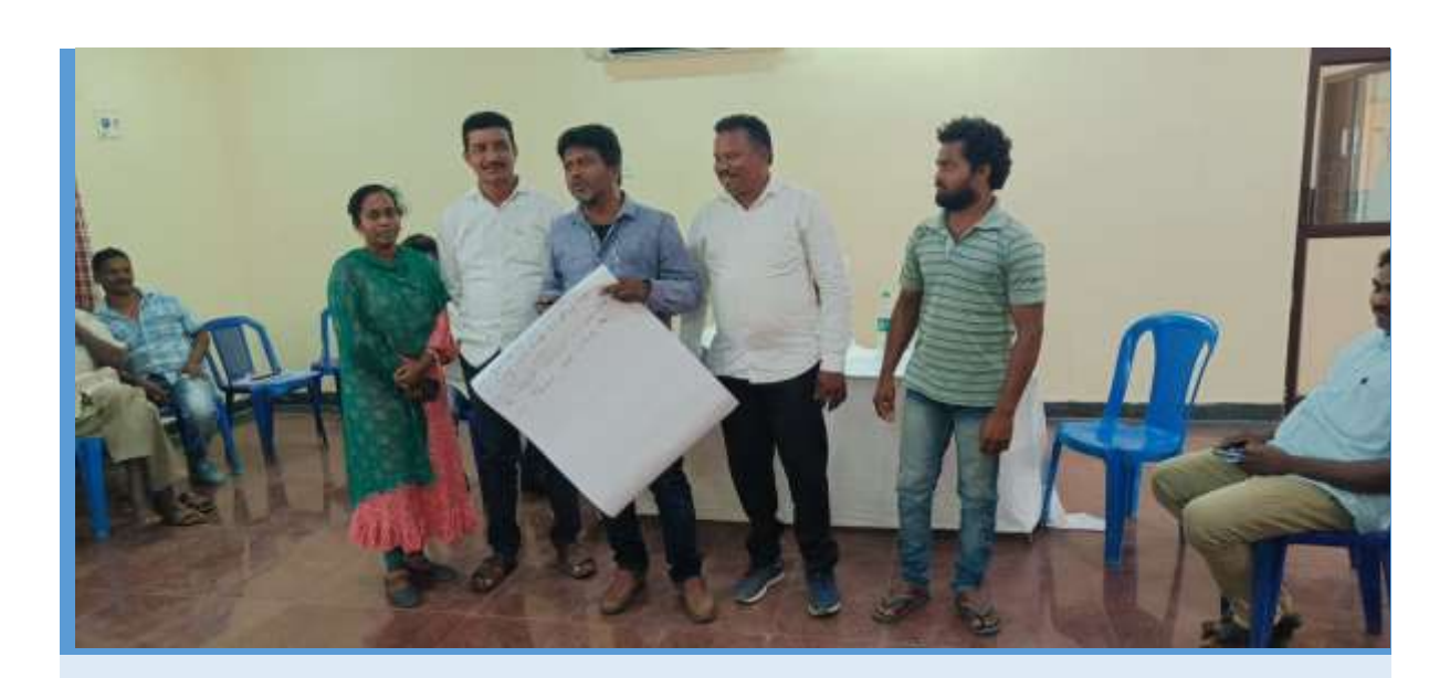
Group presentation on issues of fisherfolks in Polavaram area.