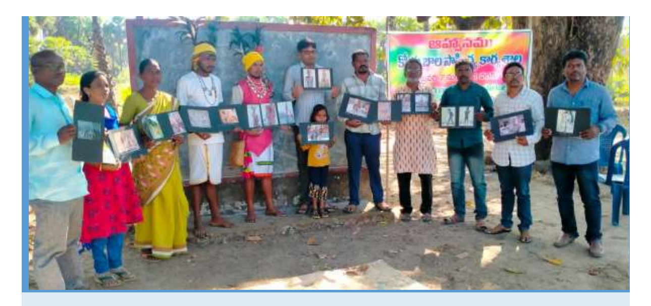
07th February 2023 to 12th Feb 2023: Samata organized a week long training program (TOT) on Koya literature at Ramannapalem, Chinthure, Alluri Seetharamraju.