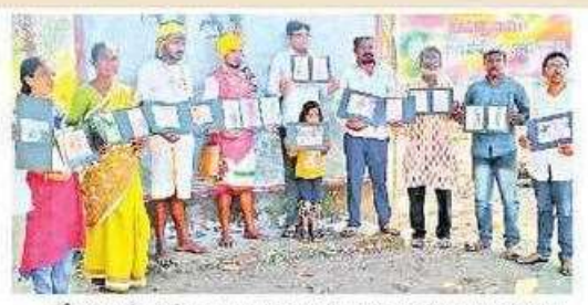
కోయ భాషా సాహిత్యాన్ని ఆవిష్కలిస్తున్న స్వచ్చంద సంస్థ నిర్వాహకులు

– యాదయ్య, కోయతోర్జుట వ్యవస్థాపకులు, రామన్సపాలెం