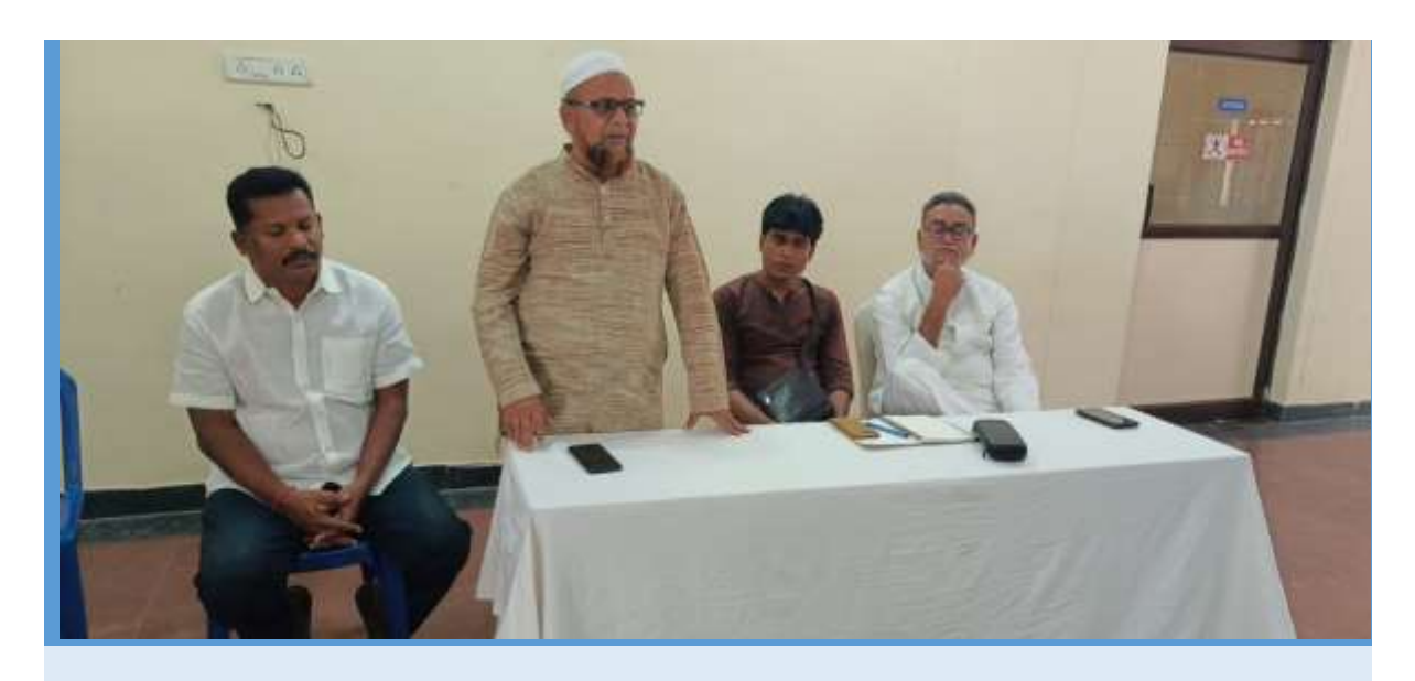
16th February 2023: Work shop on Polavaram Dam, Rehabilitation and Resettlement, West Godavari, Andhra Pradesh.